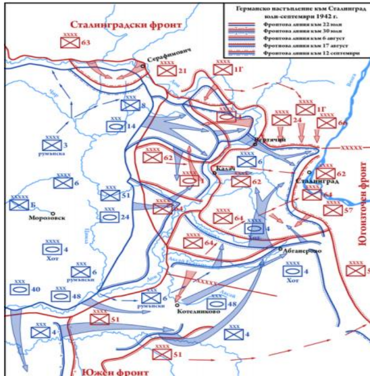
Resim 3: Stalingrad Taarruzu (Yılmaz, 2019, s. 132)

23 Ağustos 1942'nin akşamında B Ordular Grubu Volga kıyılarına ulaşmış, 30 Ağustos'ta Stalingrad'ı kuşatma operasyonu tamamlanmıştır. 3 Eylül'de Sovyet kuvvetleri mevzilerinden ayrılarak şehrin iç bölgelerine çekilmek zorunda kalmış, ertesi gün on dördüncü Alman Kolordusuna yönelik taarruz başlatmışlardır. Burada 120 Kızıl Ordu tankının otuzu Alman hava kuvvetleri tarafından yok edilmiştir. 7 Eylül'de şehrin havaalanı Alman kuvvetlerinin eline geçmiş, iki gün sonra Moskova-Astrahan demiryolu hattı kesilmiştir. Eylül ayında şehirdeki Alman ilerlemesi sürmüştü, Kızıl Ordu kuvvetleri sürekli gerilemek zorunda kalmışlardır. Muharebenin üçüncü ayında ilerleme yavaşlamış, Almanlar Volga'nın batı kıyılarına ulaşmışlardır (Yılmaz, 2019, s. 132-133).